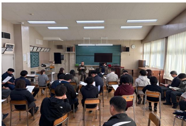
教職員研修の様子

これからも瑞雲中では教職員研修を重ね、教育効果を高めることができる指導を目指していきます。