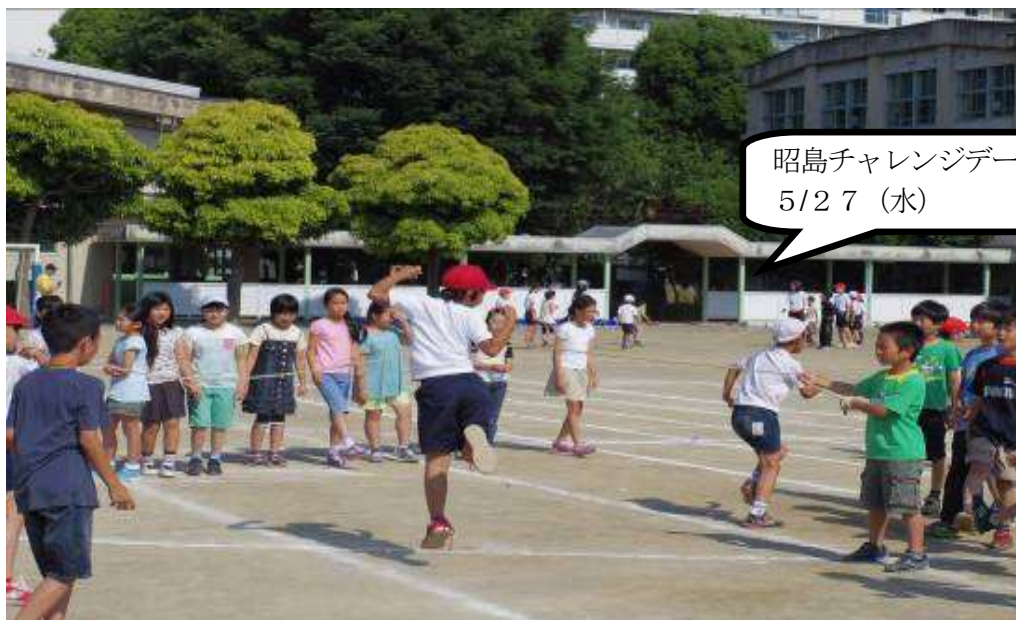
パラリンピアンから学ぶこと

平成27年度 6月号 昭島市立つつじが丘南小学校 Tel(544)6411 www.city.akishima.ed.jp/~tsunan/