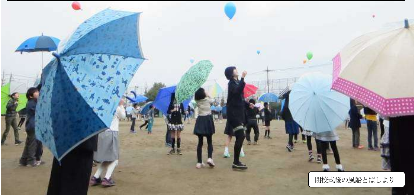
閉校式後の風船とばしより

平成27年度3月号 昭島市立つつじが丘南小学校 TEL(544)6411 www.city.akishima.ed.jp/~tsunan/