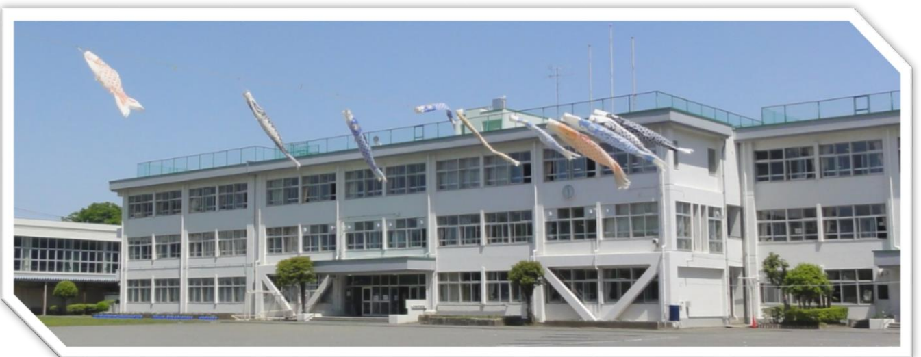
◆学校の校庭に 元気よく こいのぼり が泳いでいます◆