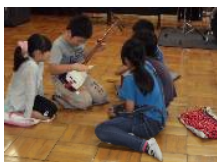
日本の伝統文化に 親しむ学習