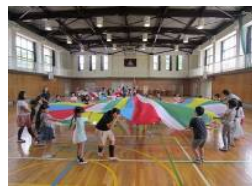
ふたば学級との交流