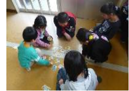
1年生と6年生の パートナー活動