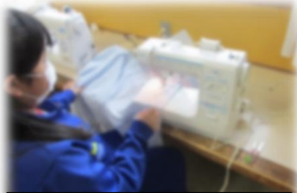
ミシンで丁寧に縫う作業