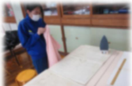
フックの取り付け作業