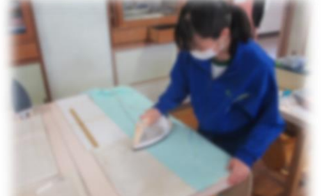
アイロンで折り目を付ける作業