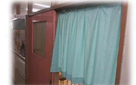
大変立派なカーテンの完成！