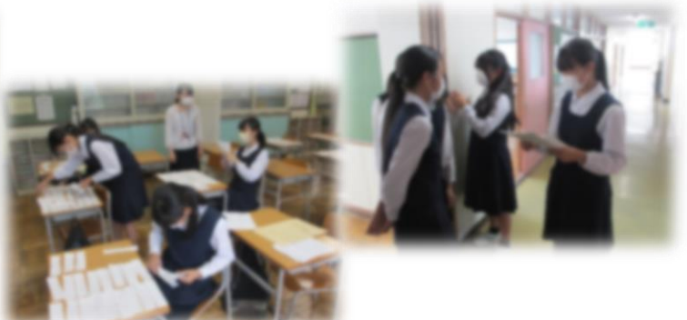
感謝メッセージの振り分け