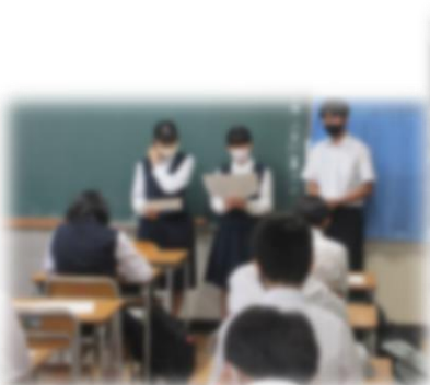
本部役員企画の説明