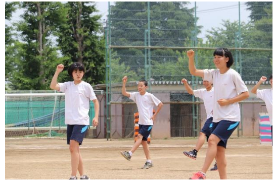
平成30年度体育祭の一コマ