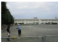
部活動も少しずつ コーラス部は屋上で。