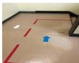
「新しい生活様式」による再開。3密の回避。