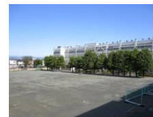
2学期また笑顔で再会。