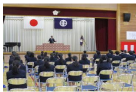
間隔あけて。1学期スタート。 マスク姿で第60回入学式。