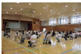
2グループに分けての保護者進路説明会。1年生、初めての定期テスト。