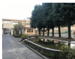
再び長い休校に。 先生たちがラジオ放送で応援。