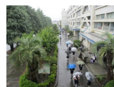
雨にも負けず土曜日登校。