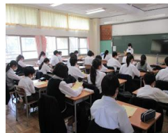
生徒たちが戻ってきました。