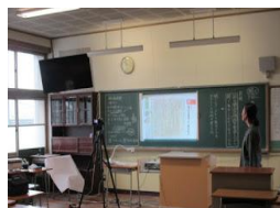
「つながるウィーク」 動画授業配信、Zoomによる質問教室