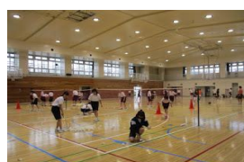
3年生は市内大会の道が開けました。