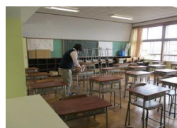
放課後、先生たちみんなで消毒。