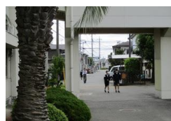
再開に向け、少しずつ。分散登校開始。