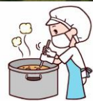
給食 みんなで「いただきます」