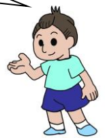
まつよ どうぞくん

人との距離をとらなければならない今、心の距離を短くして心で皆とつながっていきたくと思います。日常の教育活動や運動会などの行事で子供たちと一緒に「つながるプロジェクト」に取り組みます。共に一つのことを成し遂げる過程で「ありがとう」がたくさん生まれ、「つながっている」実感を味わえるようにしていきます。また、差別や偏見が起きないように指導を徹底するとともに、誰もがいつでも安心して学校をお休み（自宅待機等）できる雰囲気を学校全体で作っていきます。