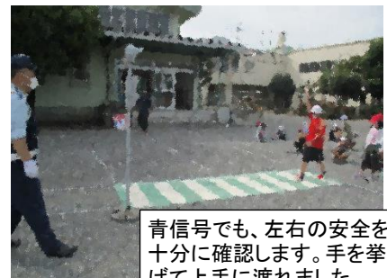
青信号でも、左右の安全を十分に確認します。手を挙げて上手に渡れました。