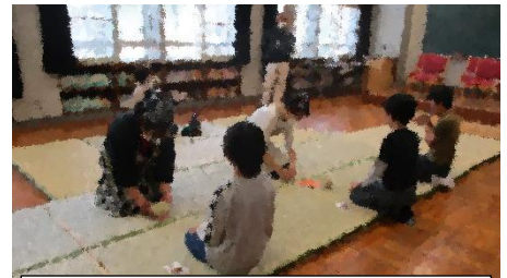
保護者の学習支援ボランティアの方々には、お茶の準備と運搬、茶器の洗浄や衛生管理などをしていただきました。安心して円滑に体験することができました。