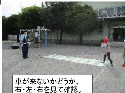
車が来ないかどうか、右・左・右を見て確認。