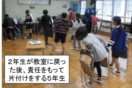
2年生が教室に戻った後、責任をもって片付けをする5年生