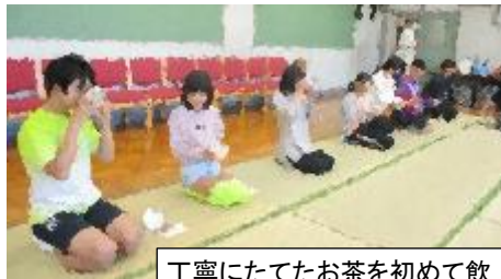
丁寧にたてたお茶を初めて飲み、児童は「味が濃い!」「苦い。」「意外と美味しい。」と、照れながら、小さな声で感想をつづやいていました。