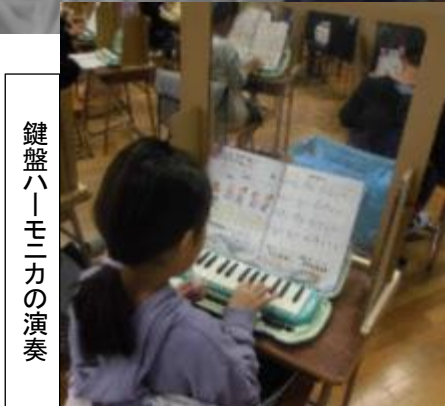
鍵盤ハーモニカの演奏