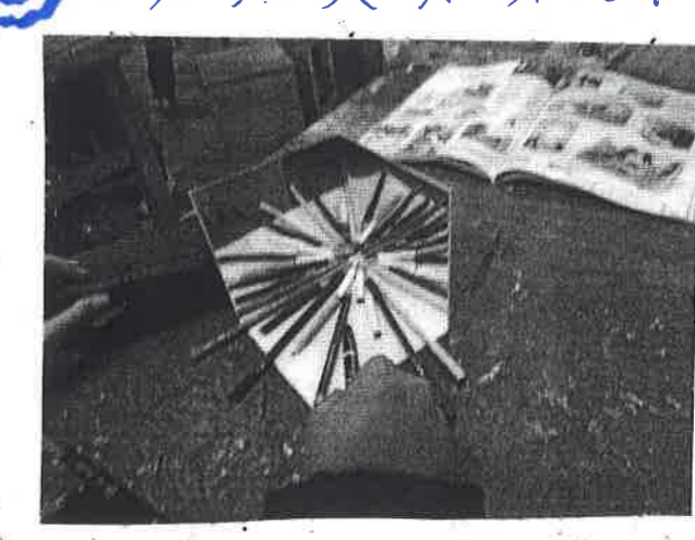
○ 写し方を試して、どんな形を写したら面白いかなと考え、表現する。