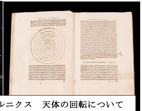
コペルニクス 天体の回転について