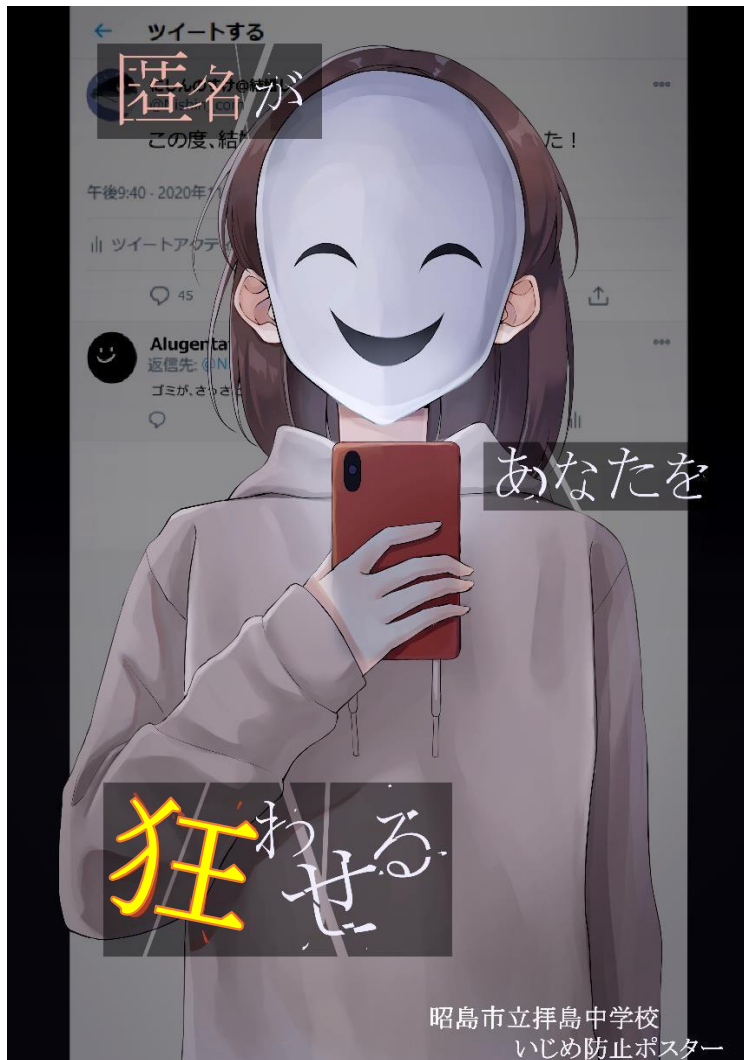
2020年度 拝島中学校 いじめ防止ポスター

「トラブルに巻き込まれた」 「悪口や個人情報が のせられているのを見つけた」 「よくない使い方を している人を見つけた」 などは、身近な大人に 報告しましょう。