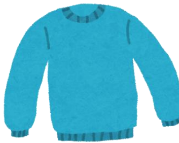
あつてなが 厚手の長そで