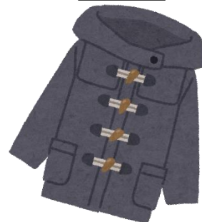
あつて 厚手の上着