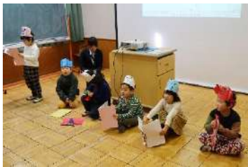
1年生 国語 朗読 どうぶつのひみつ