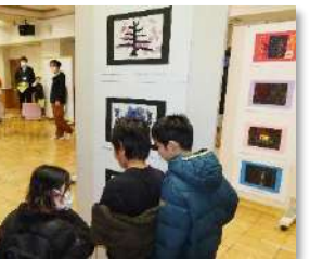
2年生 生活 えがおのひみつ たんけんたい