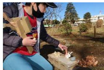
5年生 総合 ～ピオモンをつくろう！～ 身の回りの自然の良いところを伝えよう！