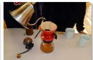
6年生 総合 ～トカゲカフェオープン～ 身の回りの課題をいかした仕事を考えながらやってみよう