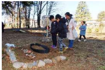
3年生 総合 ～ピオトープ改造プロジェクト～ 身の回りの地域の良いところを伝えよう