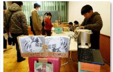
4年生 総合 ～落語家修行～ いのち×くらし めざせ！お江戸日本一の笑学生