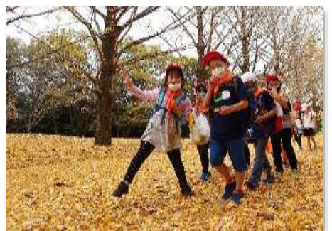
その8 季節を満喫していました。深まりゆく秋の季節を、五感を通して、全身で感じていました。