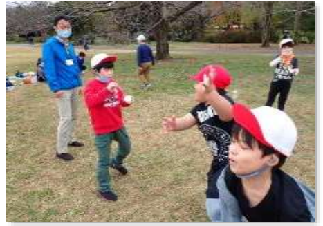
その5 自然の中で楽しんでいました。お弁当の前後は青空も出てきて、のんびり過ごしていました。