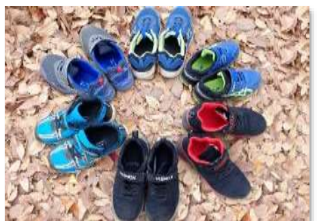
その9 整列や話の聞き方も上手でした。待ち時間も整然と、脱いだ靴も整頓していました。