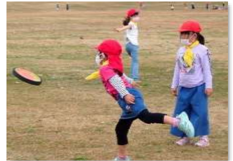
その7 思いっきり体を動かしていました。子供たちは、その時その時の楽しみ方が上手でした。