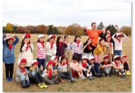
その6 1日中、たくさんの笑顔に出会いました。集合写真の一瞬は、マスクを外してもOKとしました。