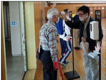
いつでも検温・消毒