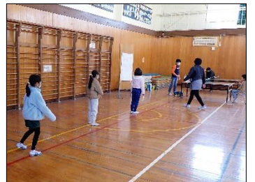
体育館でも距離を空ける