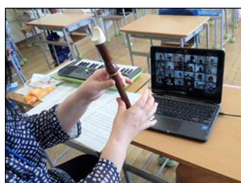
オンライン授業・自宅で音楽