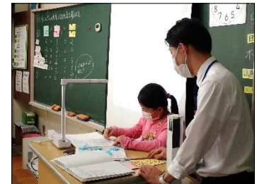
児童の発表・思考の共有