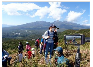
移動教室・学校行事を同時配信