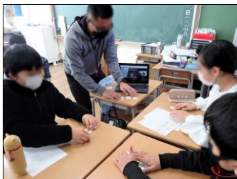
在宅のまま教室の授業に参加