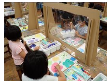
図工室のパーティション