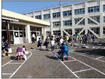
登校時の密集回避

そのため校内においては、 密閉・密集・密接の回避 を基本に、換気・身体的距離・マスク着用等の環境要因を徹底するとともに、ご家庭にも同様をお願いしています。