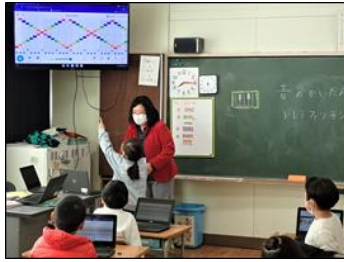
音楽・作曲アプリ