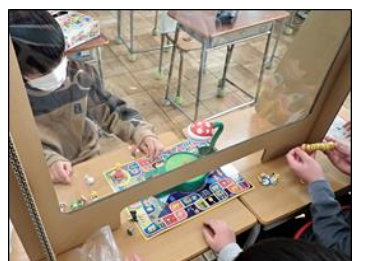
ゲームクラブのパーティション