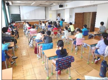
広い特別教室を学級に