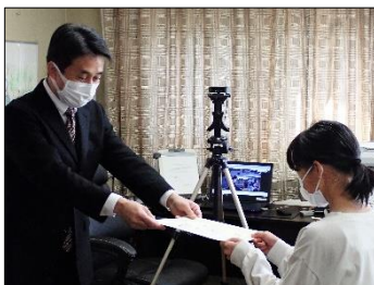
全校朝会・校長講和