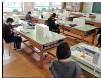
家庭科の実習の工夫