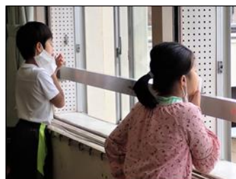
理科の実験・窓に向かって