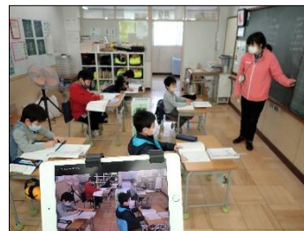
公開授業や保護者会