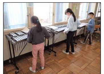
打楽器も・窓に向かって