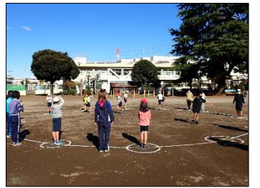
体育の運動の工夫