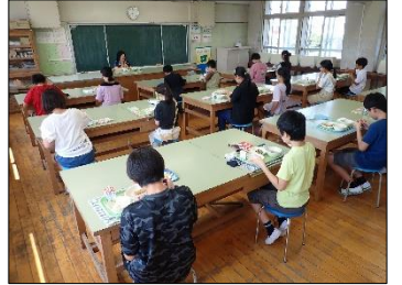
給食は2教室で分散黙食