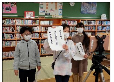
人権集会で人権標語と作文発表