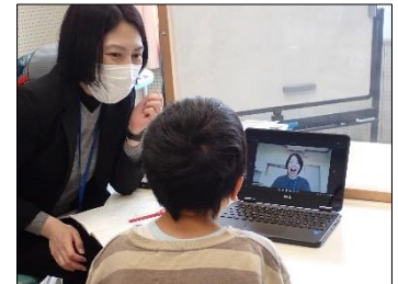
難聴言語・自作動画で指導