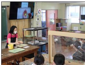
図工・大型TVで演示