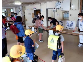
入校前の健康チェック