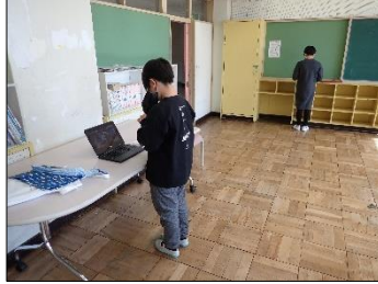
管楽器は4教室で分散演奏