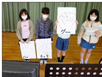
児童集会や体育集会