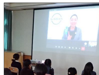
双方向でバーチャル工場見学