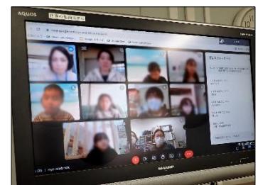
難聴言語・小グループ活動