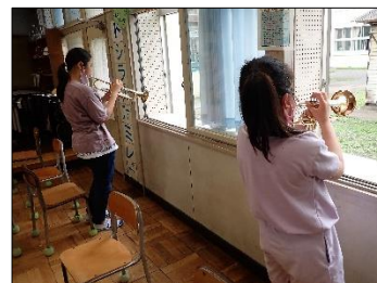
音楽クラブ・窓に向かって