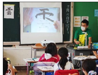
書写・プロジェクターで演示