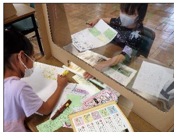
図書館のパーティション