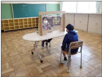
個人面談のパーティション