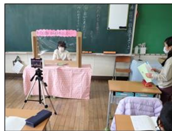
国語の発表の工夫

とりわけ、「感染症対策を講じても感染のリスクが高い学習活動等」をリストアップし、緊急事態宣言やまん延防止等重点措置の期間などに応じて、 感染を正しく怖れることで、柔軟かつ慎重に判断して感染症防止を徹底 しています。