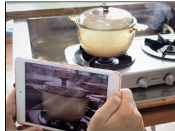
家庭科・調理実習を演示