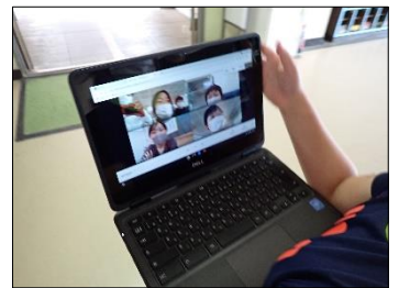
校内オンラインで話し合い活動