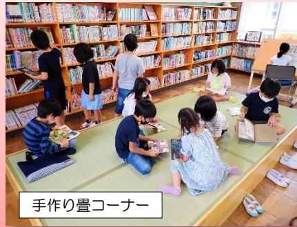
手作り畳コーナー

子供たちの想像力を培い、豊かな心や人間性、教養を育み、感性を磨く読書活動や読書指導の場として。