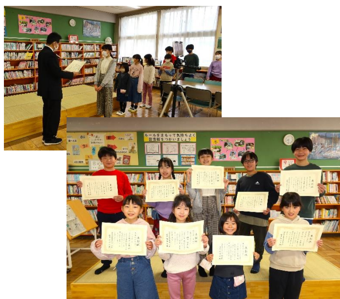
思索チャレンジコンテスト「校長賞」受賞者