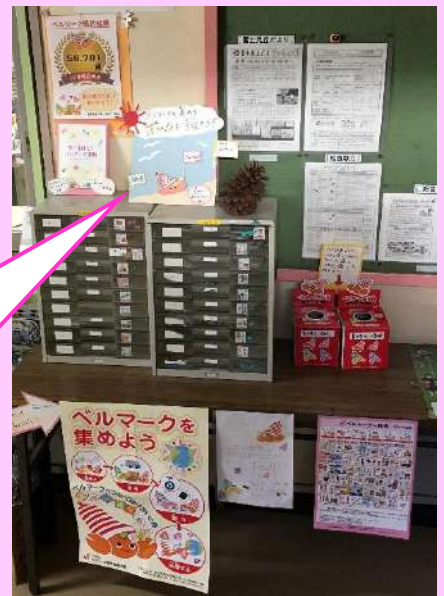
事務室前の回収コーナー