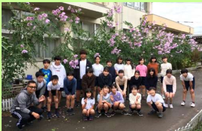
球根を手に記念撮影。後ろの皇帝ダリアも見事です。