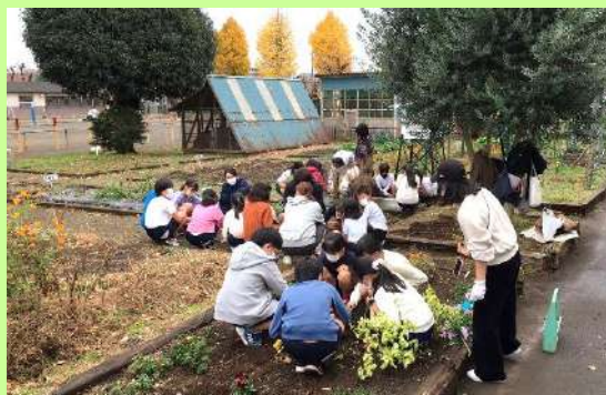
何色のチューリップが咲くかな？