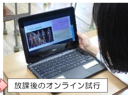
放課後のオンライン試行