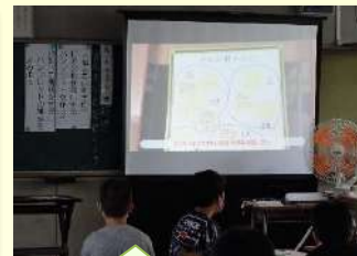
拡大して思考を共有 53