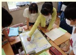
発表ボードを活用 62