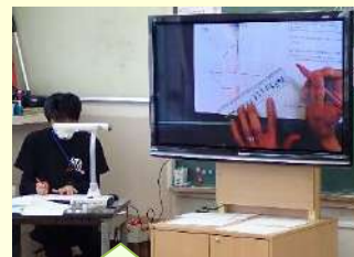
ノートを拡大して説明 54