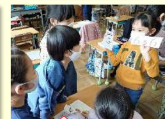
フラッシュカード 65