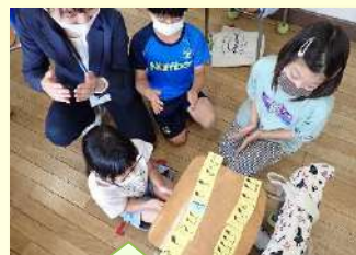
カードの並べ替え 51