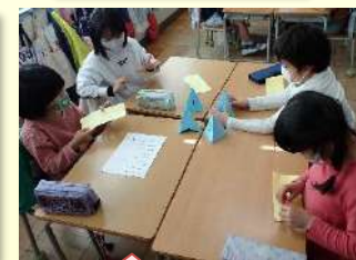
役割分担を明確に 66