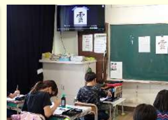
動画でポイントを説明 56