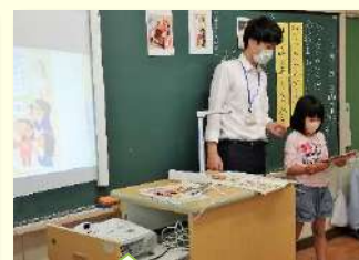
自分の意見を発表 57