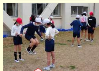
難易度を工夫して 63