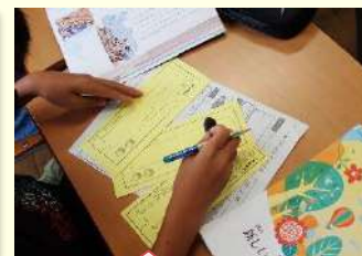
大事なことはメモ 60