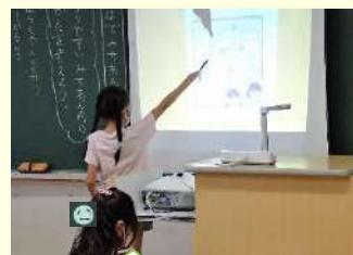
実物投影機を活用 55