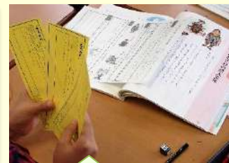
意見をカードに書く 52